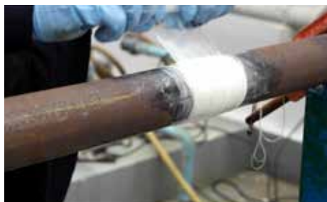
4. Aplique la película