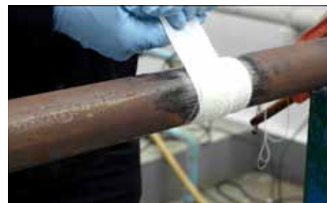
3. Aplique la envoltura