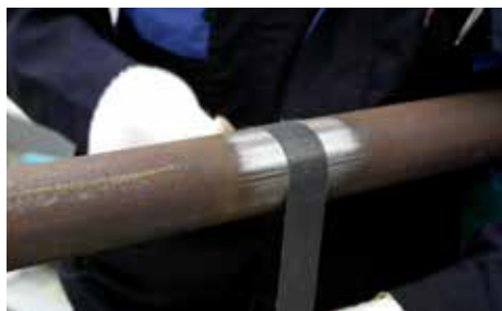
1. Lije para aumentar la aspereza y limpie la superficie