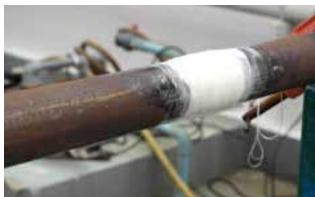
5. Aplicación finalizada