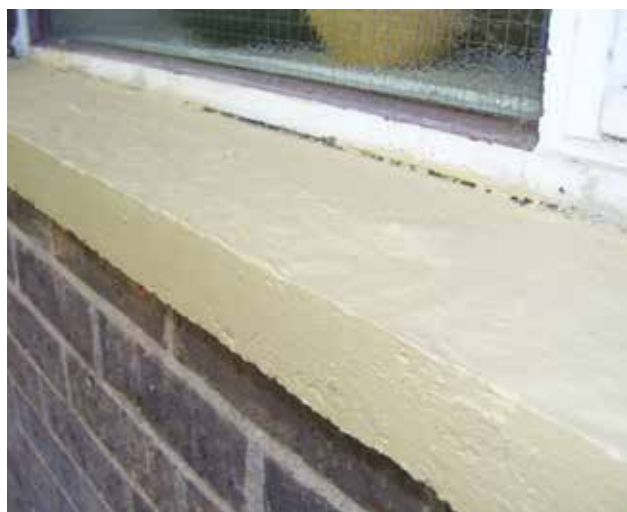
Belzona 5151 aplicado en dinteles y umbrales de ventanas