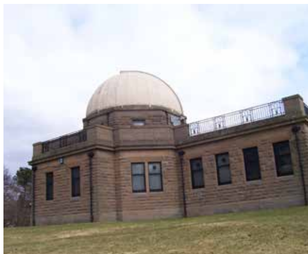
Belzona 5151 ofrece un acabado estéticamente agradable

Si necesita más información, comuníquese con el representante de Belzona de su localidad: