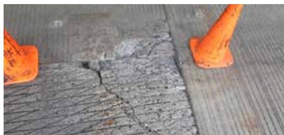
Un panel de hormigón presentaba agrietamiento y causaba problemas en el camino.

Se adhiere perfectamente a superficies metálicas y de mampostería, como: hormigón, ladrillo, mármol y piedra.