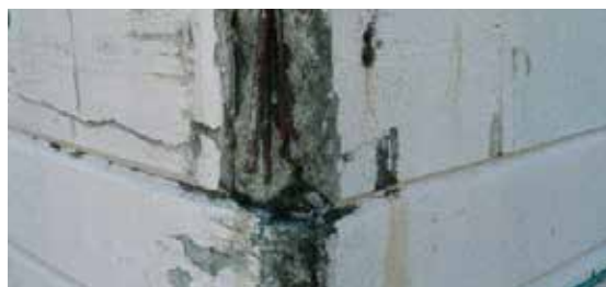
La esquina de una pared presentaba graves daños.