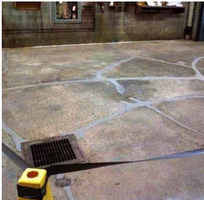
Grieta reparada con el sistema Belzona 4151 y 4111

Belzona 4151 (Magma-Quartz Resin) es un recubrimiento de dos componentes diseñado para proteger los sustratos de hormigón de la humedad y el ataque químico.