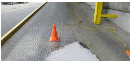
Se empleó el sistema Belzona 4151 + 4111 para reconstruir y alisar el área agrietada.