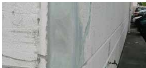
Primero se inyectó Belzona 4151 y luego se rellenaron las grietas con Belzona 4111.

Si necesita más información, comuníquese con el representante de Belzona de su localidad: