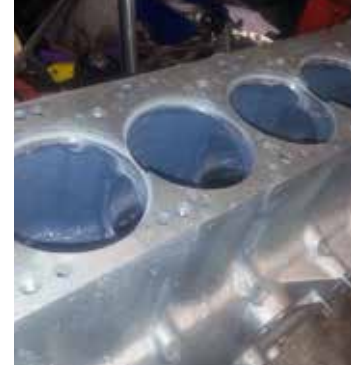
Bloque de motor recubierto