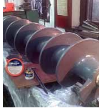
Protección de transportadores sinfín