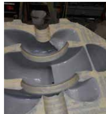
Revestimiento de bomba