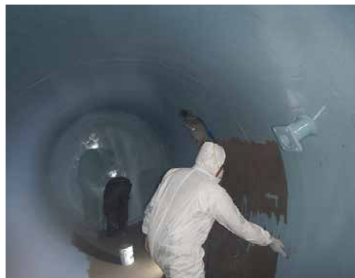
Aplicación manual de Belzona 1391T

Si necesita más información, comuníquese con el representante de Belzona de su localidad: