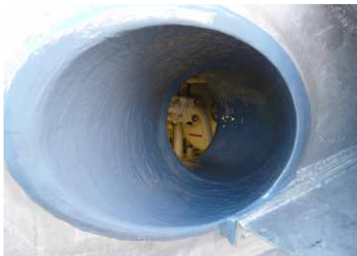
Protección del escape en un yate

Si necesita más información, comuníquese con el representante de Belzona de su localidad: