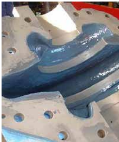
Revestimiento de bombas