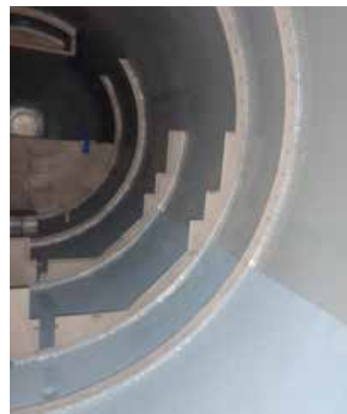
Revestimiento de recipientes